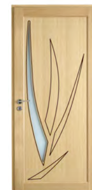
Côté intérieur en bois